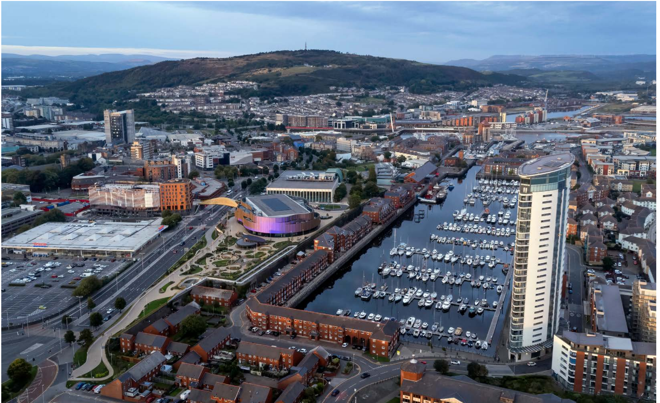
Strategaeth Trais yn erbyn Menywod, Cam-drin Domestig a Thrais Rhywiol Abertawe 2023-2026